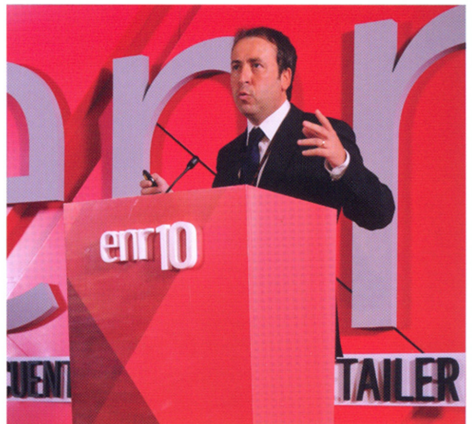
Su conferencia fue una de las más concurridas de la tarde, siguiendo lineamientos de su análisis de crecimiento y evolución del mercado.