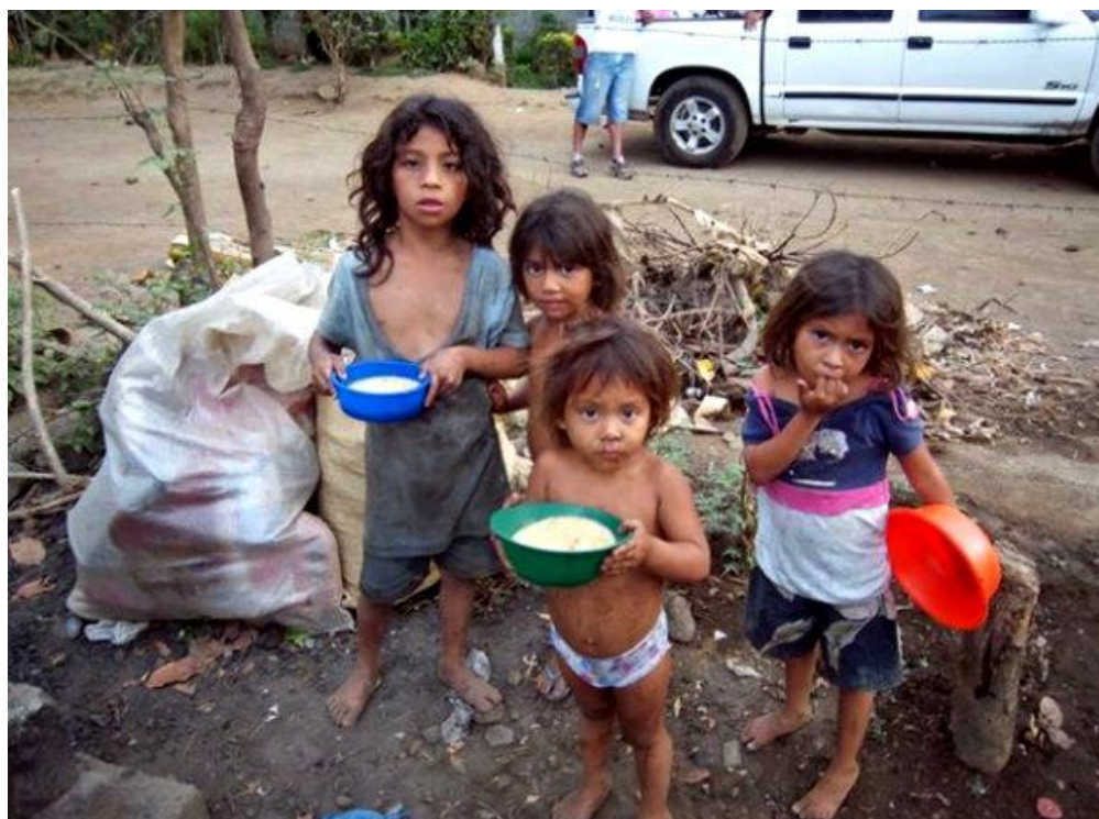
Niños de la provincia del Chaco alimentándose en el basurero municipal. (año 2015).

* Todos los valores mencionados corresponden al promedio del reciente año 2015. Los datos de población son considerados a partir de estimaciones del INDEC.