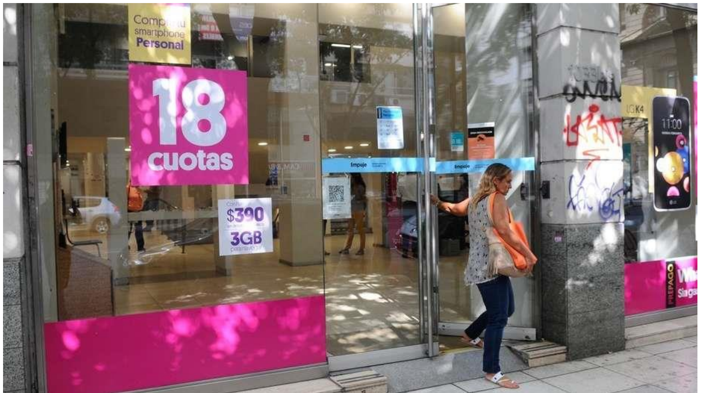
El confianza del consumidor bajó en febrero tas el plan Precios Transparentes.

El PBI crece más lento que a la salida de la recesión de 2014, el consumo da despasejo y el repunte vendrá desde el interior a las grandes ciudades cerca de mitad de año.